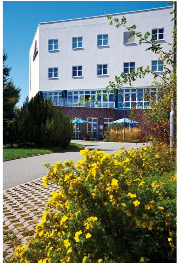
Abbildung: Blick auf die Pleißeental-Klinik

Die Betriebsleitung der Pleißeental-Klinik GmbH